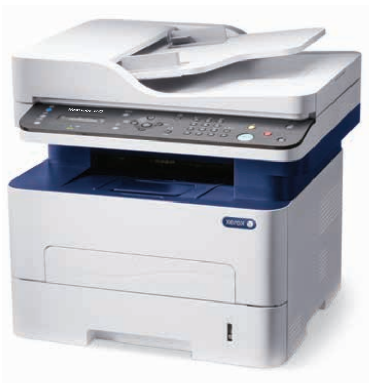
WorkCentre 3225: kopírování, tisk, skenování, faxování, e-mail.