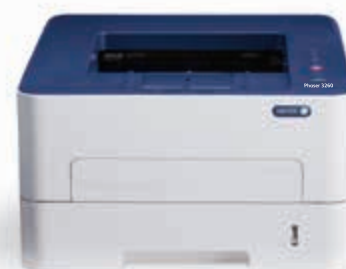
Phaser 3260: tiskárna.